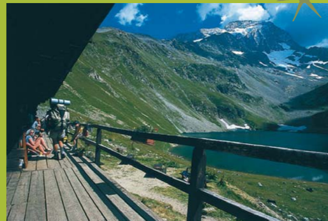
Refuge de la Muzelle